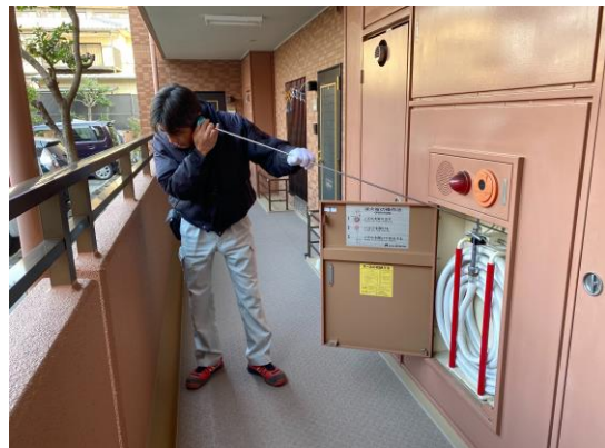
音聴棒にて消火栓の音聴