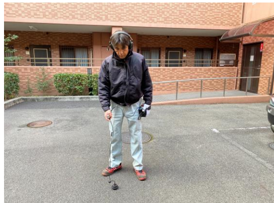
漏水探知機にて路面音聴