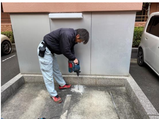
漏水音発生箇所を路面ボーリング