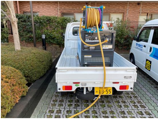
コンプレッサーを送水口に接続し、圧縮空気を充填