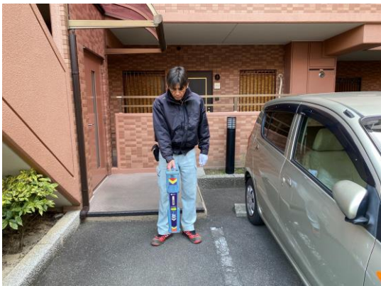
埋設管の位置を確認