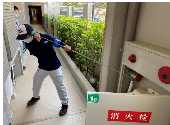
音聴棒にて消火栓の音聴