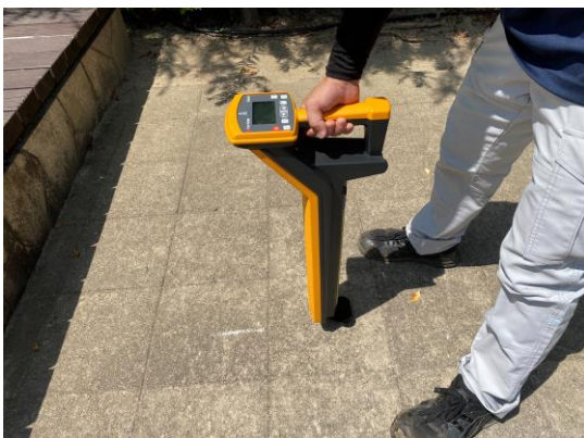
埋設管の位置を確認