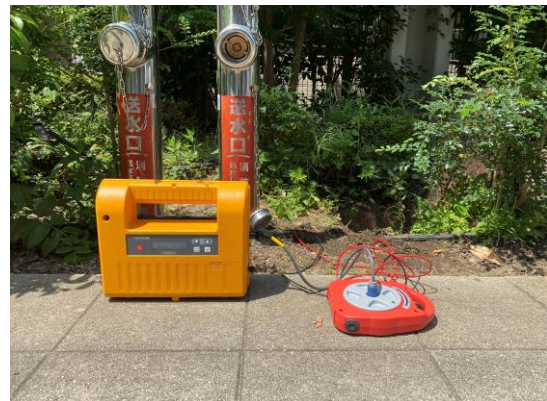
埋設管路調査を実施