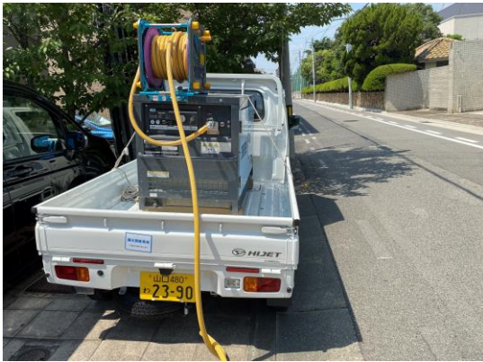
コンプレッサーを送水口に接続し、圧縮空気を充填