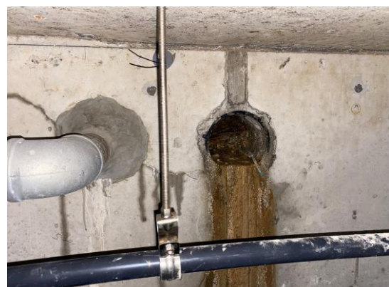
ピット内貫通部で漏水を確認し調査終了