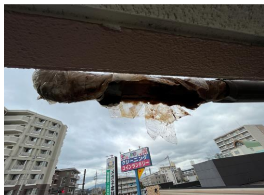
保温材撤去 漏水箇所を確認