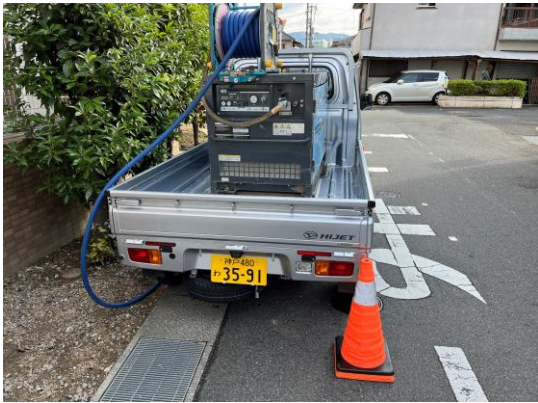
コンプレッサーを消火栓に接続し、圧縮空気を充填