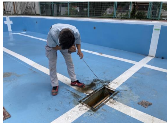
音聴棒にて音聴作業