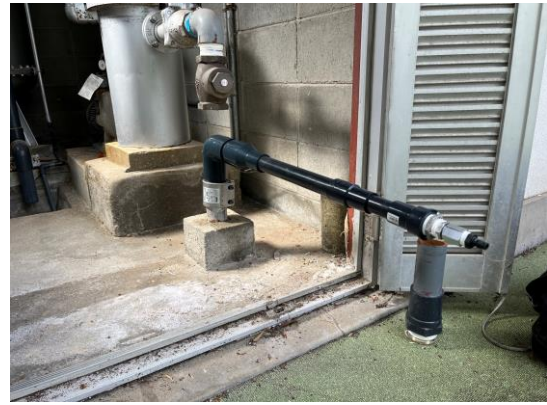
エア充填用治具取付