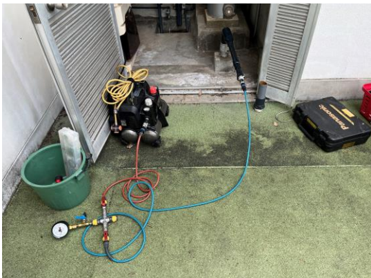
配管内に圧縮空気を充填