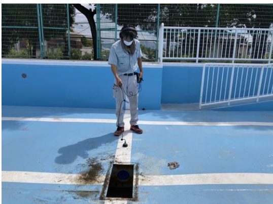
漏水探知機にて路面音聴