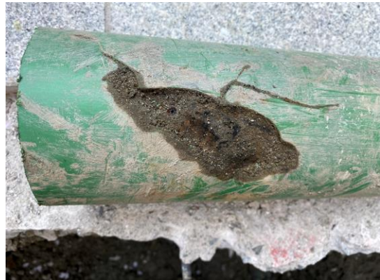
漏水箇所拡大 腐食による穴あき