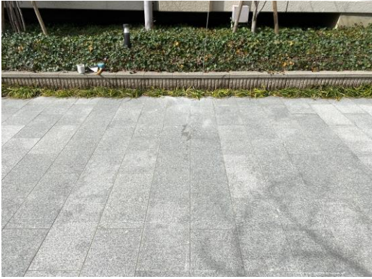
漏水調査を実施した施設の漏水修理工事を実施