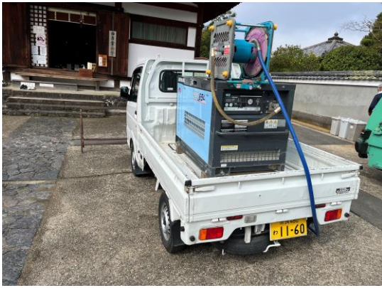
コンプレッサーを消火栓に接続し、圧縮空気を充填