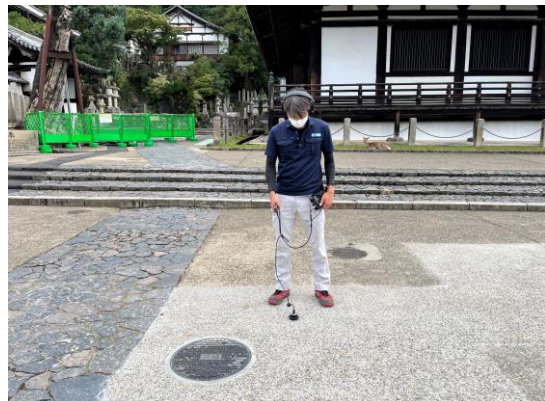
漏水探知機による音聴