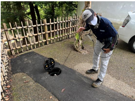
音聴棒による音聴