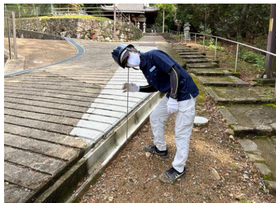
地中音聴により漏水箇所を特定