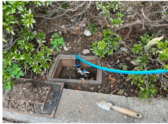
散水栓にコンプレッサー接続