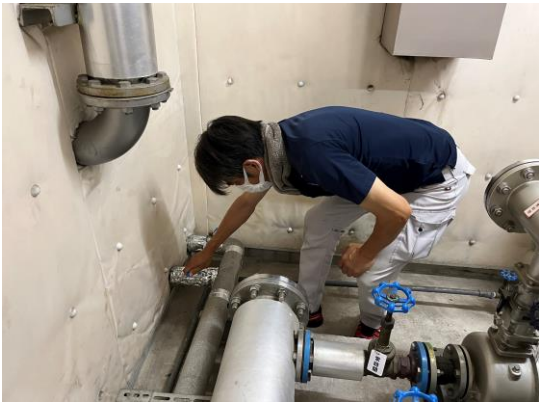
系統バルブを閉止し、断水を実施。