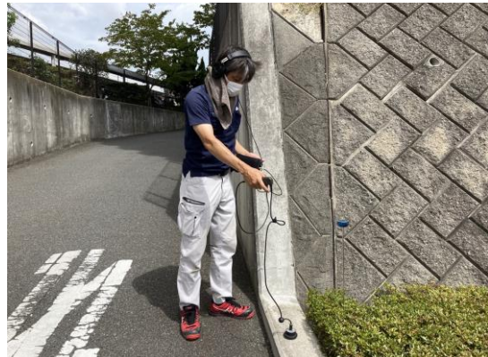
漏水探知機にて路面音聴を実施。