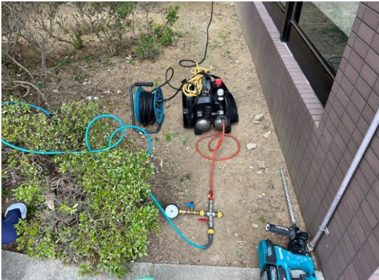
配管内に圧縮空気を充填。