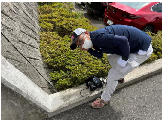
音聴棒にて地中音聴を実施。