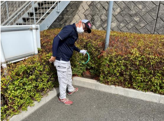
音聴棒にて音聴調査を実施。