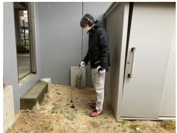
漏水探知器による音聴