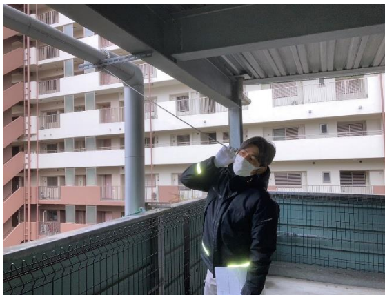
音聴棒による音聴