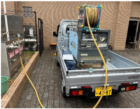
コンプレッサーを送水口に接続