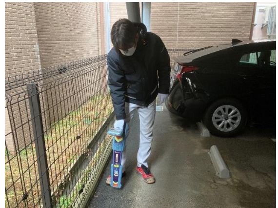
鉄管探知機による埋設管探査