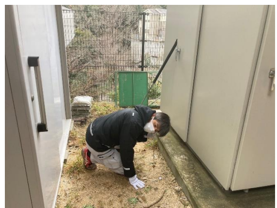
地中音聴により漏水箇所を特定