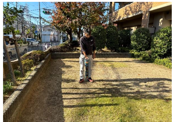
鉄管探知器による管路調査