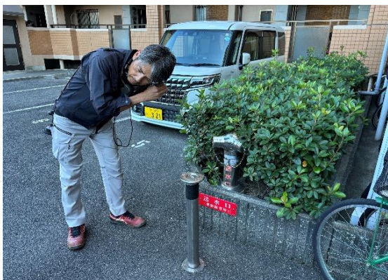
音聴棒による音聴