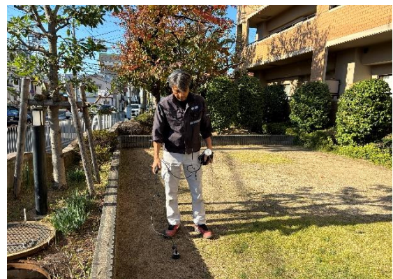
漏水探知器による音聴