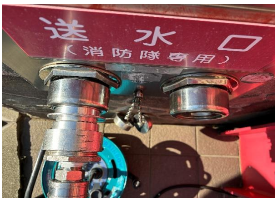
送水口パッキンにて漏水を確認